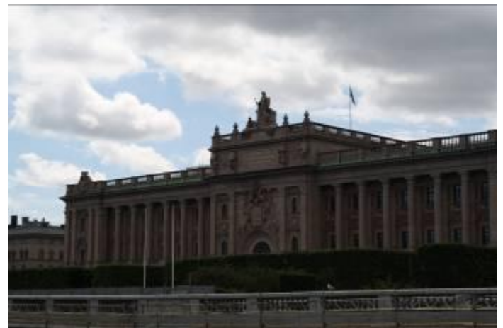
De Rijksgedebouwen (Parlement)

Kortom Stockholm is een prachtige stad waar veel te zien en te beleven is.