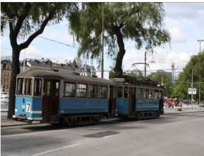
In Stockholm rijden nog oude trams

Daar we ook in Zweden niet met 80 gasten mochten varen maar slechts met 59, moesten de rest van de gasten met een ander scheepje mee (de Ballerina) hiervoor moesten we regelmatig eten en drinken overzetten.