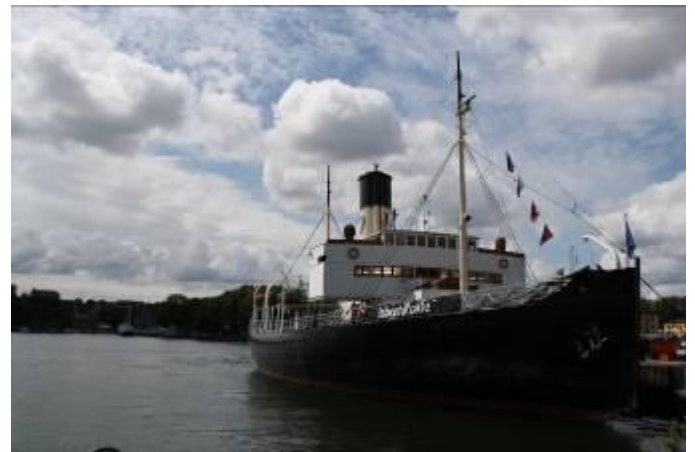
De "Sankt Erik" een stoomsleper/ijsbreker uit 1915