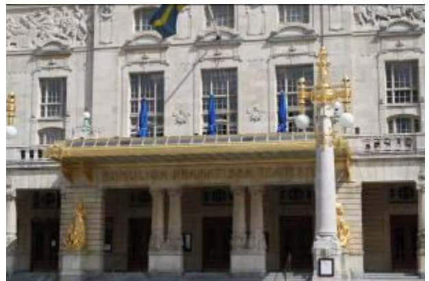
Het Koninklijk theater

Op vrijdag zijn er een aantal mensen de wal op geweest om te gaan kijken bij het dansen rond de Meiboom en voor een bezoek aan het Wasa museum. Ook de volgende dag werden er diverse bezienswaardigheden bekeken.