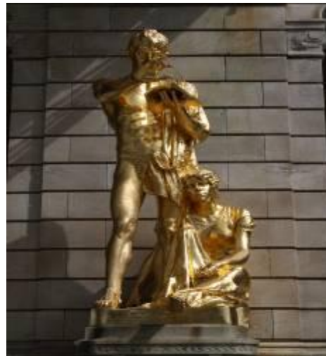
Met prachtige gouden beelden