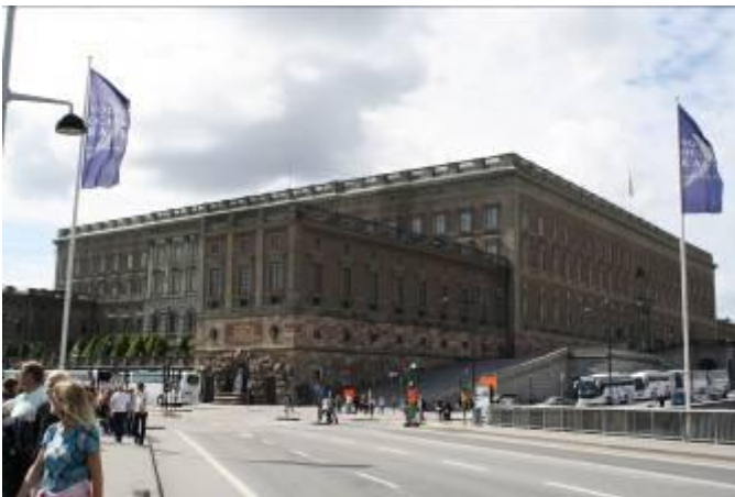
Het Koninklijk paleis